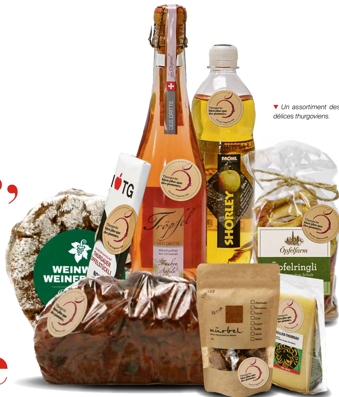
▼ Un assortiment des délices thurgoviens.